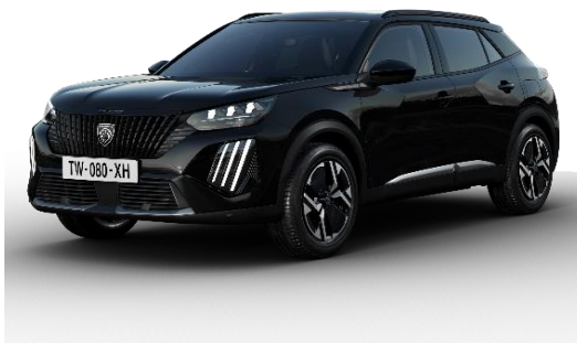
Perla Nera black