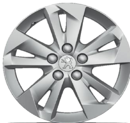
TARANAKI 15" Allure