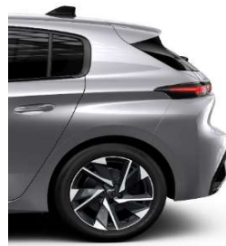
Allure Pack 17' Alloy Halong